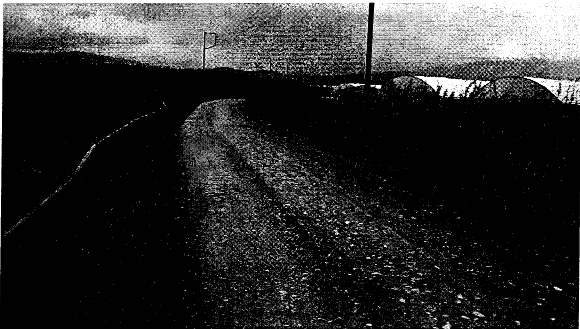
Εικόνα 2 Χαρακτηριστική εικόνα της οδού

Κατά την κατασκευή του έργου θα γίνει εκσκαφή σε έδαφος αποκλειστικά γαιώδες. Οι εκσκαφές θα ανέρχονται στο σύνολο τους σε 750,0 κυβικά μέτρα, εκ των οποίων μέρος θα χρησιμοποιηθεί για τη κατασκευή των επιχωμάτων, τα οποία ανέρχονται σε 950,0 κυβικά μέτρα.