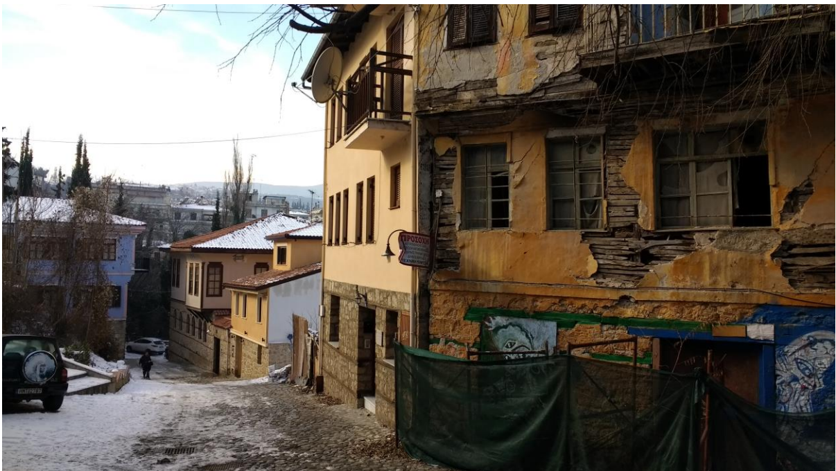
ΦΩΤ. 8. Η οδός Εβραίων Μαρτύρων στην συνοικία της Μπαρμπούτας