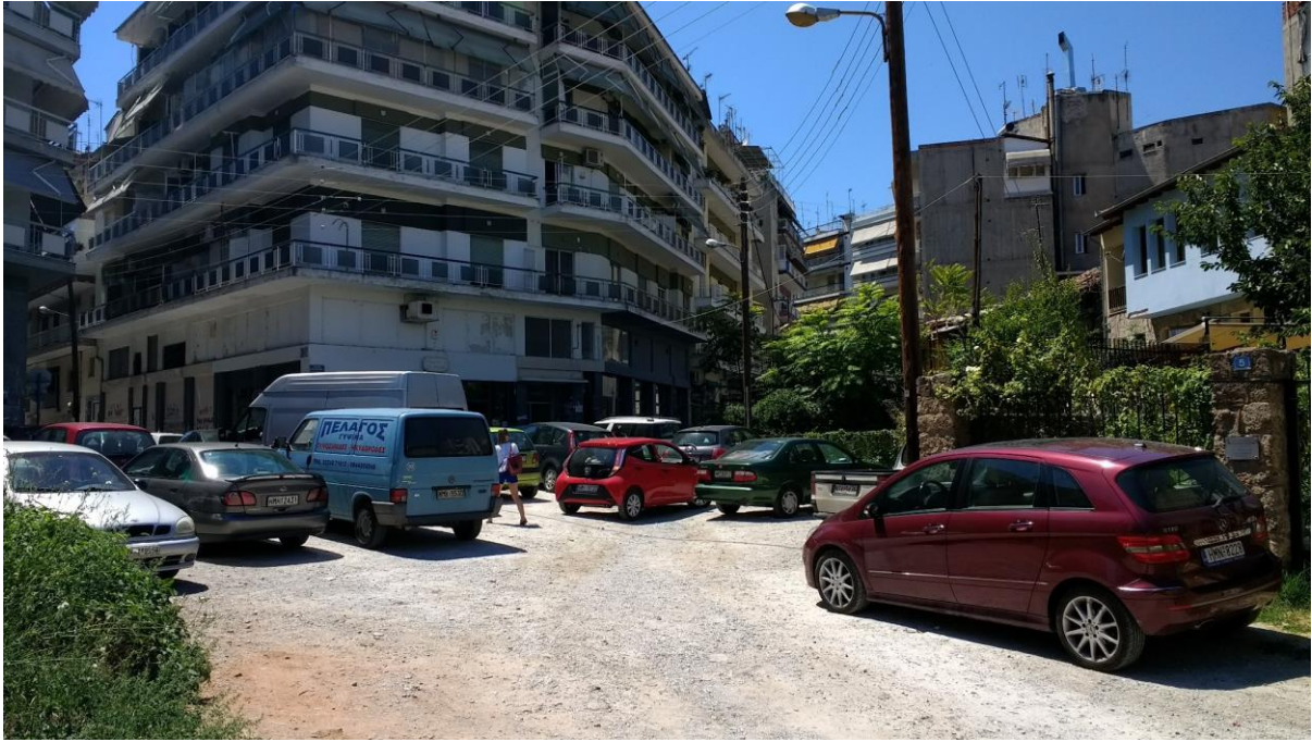
Φωτ. 3. Η σημερινή κατάσταση του χώρου όπου προβλέπεται η Πλατεία Δίδυμων Λουτρώνων: ανεξέλεγκτη στάθμευση και κατάληψη δημόσιου χώρου, σε επαφή με το μνημείο