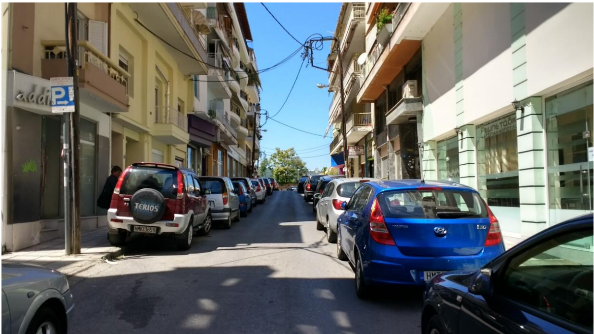
Φωτ. 6. Η οδός Περικλέους με κατεύθυνση προς την Παλαιά Μητρόπολη και τη συνοικία της Παναγίας Δεξιάς