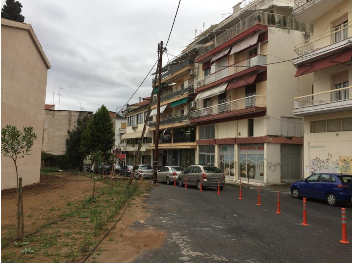
ΦΩΤ. 7. Η οδός Αντωνίου Καμάρα, στη νότια πλευρά της Παλαιάς Μητρόπολης