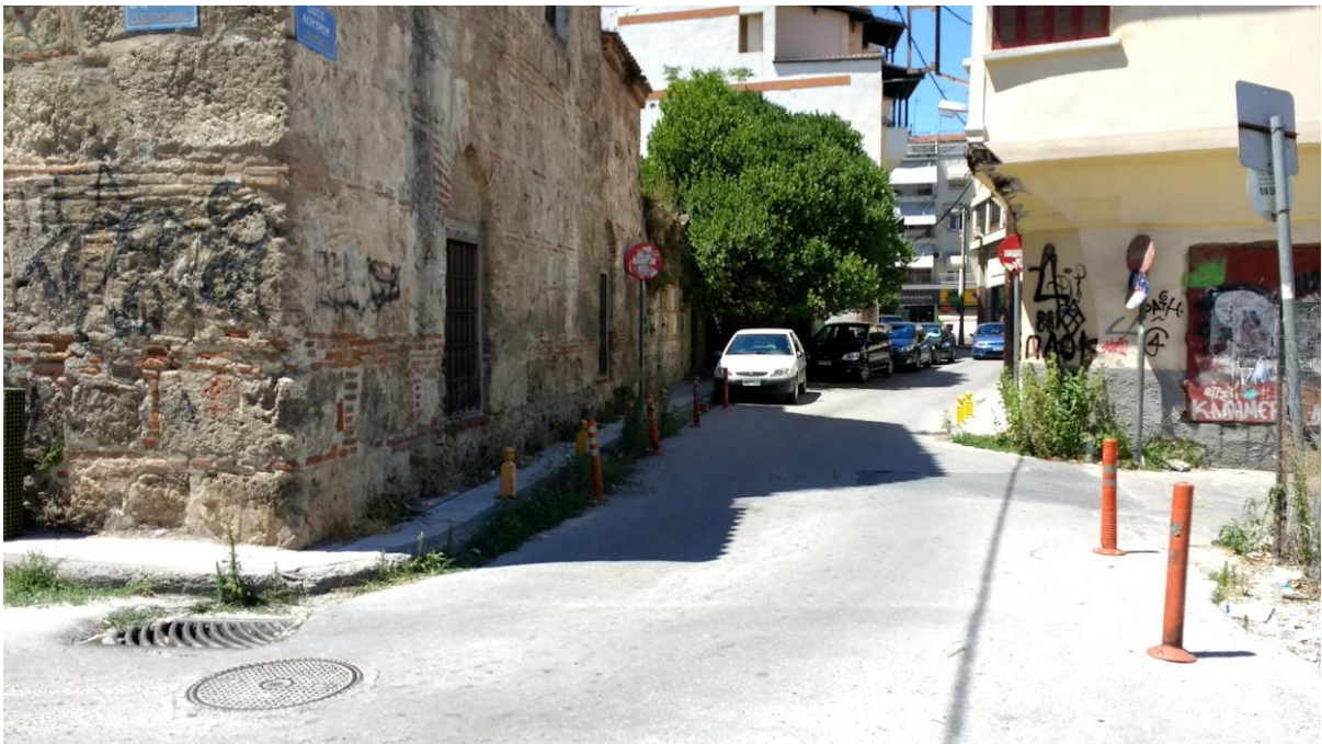
Φωτ. 4. Η οδός Λουτρού με κατεύθυνση προς την οδό Μητροπόλεως: δυσχερής κίνηση των πεζών