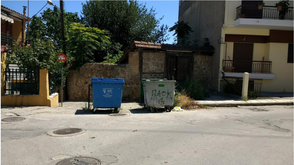
Φωτ. 1. Συμβολή οδού Κυριωτίσσης με πεζόδρομο που οδηγεί στο Βυζαντινό Μουσείο (οδό Θωμαΐδου): υποβάθμιση αστικού περιβάλλοντος, έλλειψη σήμανσης και συνέχειας της διαδρομής