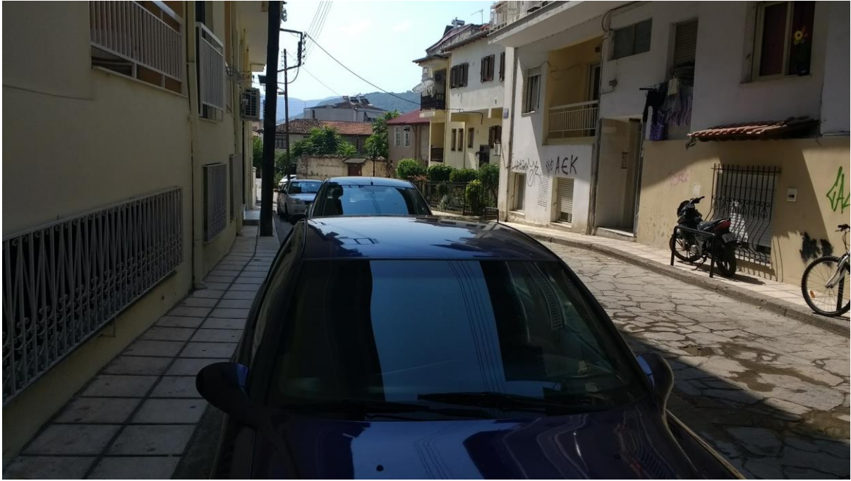
Φωτ. 5. Η οδός Μυτιλέκα στη συνοικία της Κυριώτισσας: αν και πεζόδρομος, παρόμοια προβλήματα κίνησης για τους πεζούς, κυριαρχία των αυτοκινήτων, μη υδατοπερατά υλικά επίστρωσης