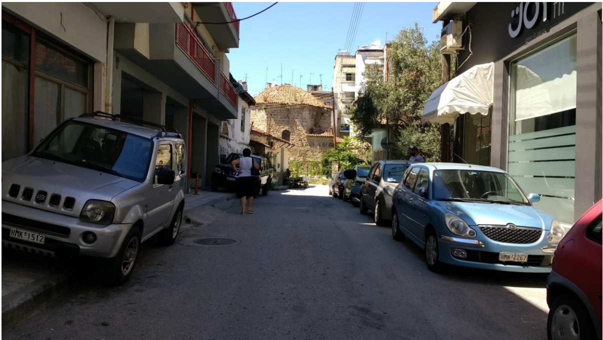
Φωτ. 2. Οδός Κυριωτίσσης με κατεύθυνση προς τους Δίδυμους Λουτρώνας: πολύ στενά πεζοδρόμια, συχνά κατειλημμένα από παράνομα σταθμευμένα αυτοκίνητα