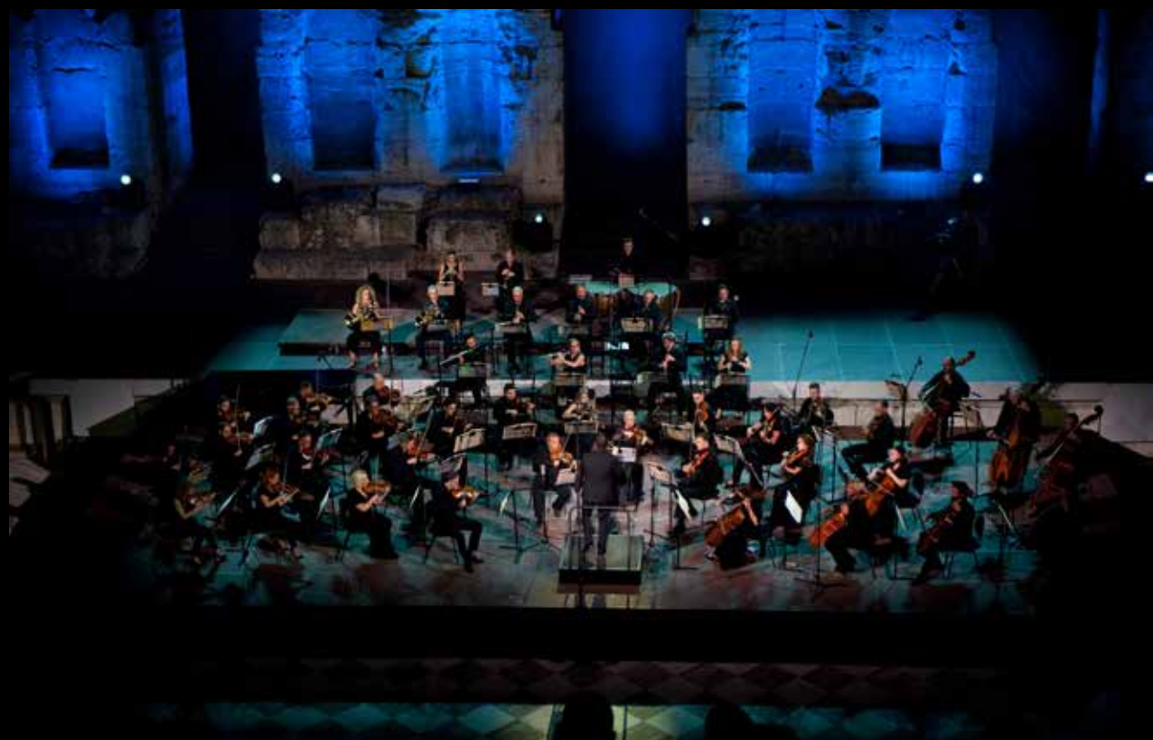
Εθνική Συμφωνική Ορχήστρα της ΕΡΤ