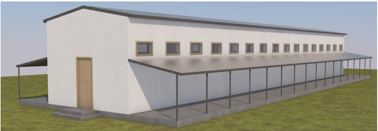
Το νέο κτίριο των κλωβών

Το νέο κτίριο θα τοποθετηθεί κάθετα στους υπάρχοντες αδειοδοτημένους κλωβούς και θα έχει διαστάσεις 33,30 X 11,40. Περιλαμβάνει δυο αντικριστές σειρές κλωβών με κοινό εσωτερικό διάδρομο. Η κάθε σειρά κλωβών έχει εξωτερικούς χώρους για τον αυλισμό των ζώων σύμφωνα με τις ισχύουσες προδιαγραφές. Οι διαστάσεις των νέων κλωβών είναι οι απαιτούμενες 2,00X2,00X2,00 με ανάλογο αύλειο χώρο.