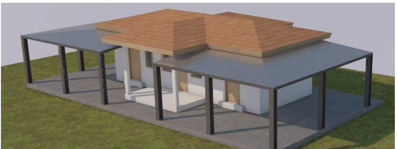
τα στέγαστρα του κτιρίου διοίκησης